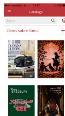
Fig. 2 App Ebiblio